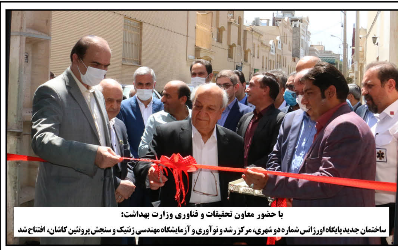
با حضور معاون تحقیقات و فناوری وزارت بهداشت: ساختمان جدید پایگاه اورژانس شماره دو شهری، مرکز رشد و نوآوری و آزمایشگاه مهندسی ژنتیک و سنجش پروتئین کاشان، افتتاح شد